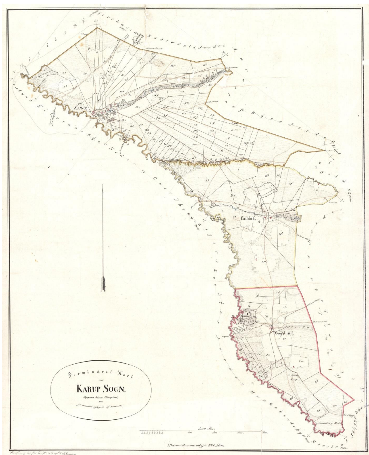
Her er sognekortet over Karup 1834 i fuld størrelse. Kortet viser tydeligt, at mod nordøst følger grænsen mellem bymarkerne den lille bæk (den officielle grænse). Det er udelukkende ved mosen og kæret, at skellet er flyttet længere mod nordvest ind på Høgild Bymark.